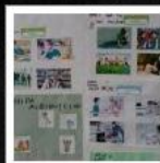
LICEUL DE ARTE DIMITRIE CUCLIN - GALAȚI - GALAȚI...