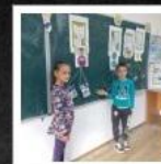
Școala gimnazială nr.1 Rebra - Rebra - Bistrița...