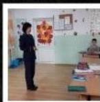
SC.GIMN. ION AGARBICEANU - ALBA IULIA - Alba - ----