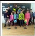
Liceul Tehnologic Vasile Netea - Deda - Mureș - P...