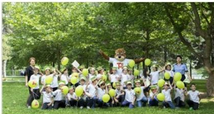
Școala siguranței Tedi încheie cel de-al treilea an!