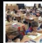
Liceul Teoretic Bilingv Miguel de Cervantes - Bucu...