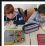
ȘCOALA GIMNAZIALĂ TG. TROTUȘ - TÂRGU -----