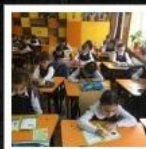
ȘCOALA GIMNAZIALĂ NR. 22 - GALAȚI - -----