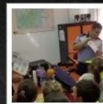
ȘCOALA GIMNAZIALĂ RACȘA - RACȘA - -----