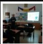
Scoala Gimn. T. Arghezi Pitesti - Pitesti - Arges ...