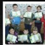
Scoala Gimnaziala Deaj - DEAJ - MURES - GAGYI -----