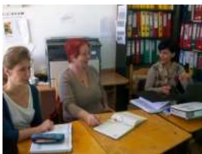
Foto 1 - Pregătire pedagogică

Activități de pregătire: promovarea proiectului, constituirea echipei (concurs), selecție participanți la mobilități, încheiere contracte cu organizațiile de primire și cu fiecare participant, pregătire pedagogică a participanților (20h), pregătire lingvistică (20h), pregătire culturală (4h), pregătire pre-curs solicitată de organizația de primire, elaborare documente de lucru interne (fișe de atribuții, acte adiționale, proceduri, instrumente de monitorizare și evaluare)