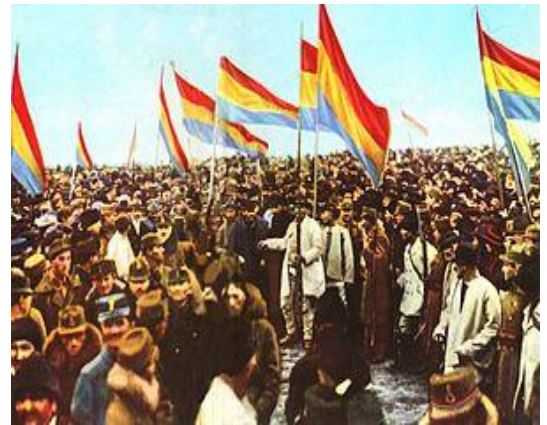
Adunarea Națională de la Alba Iulia (1 decembrie 1918)

Octavian Goga, "Latinitatea strigă din tranșee", 1916