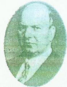
Ion Inculeț (1884-1940)

Președintele Sfatului Țării din Basarabia.