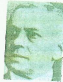
Iancu Flondor (1865-1924)

Președintele Sfatului Țării din Basarabia.