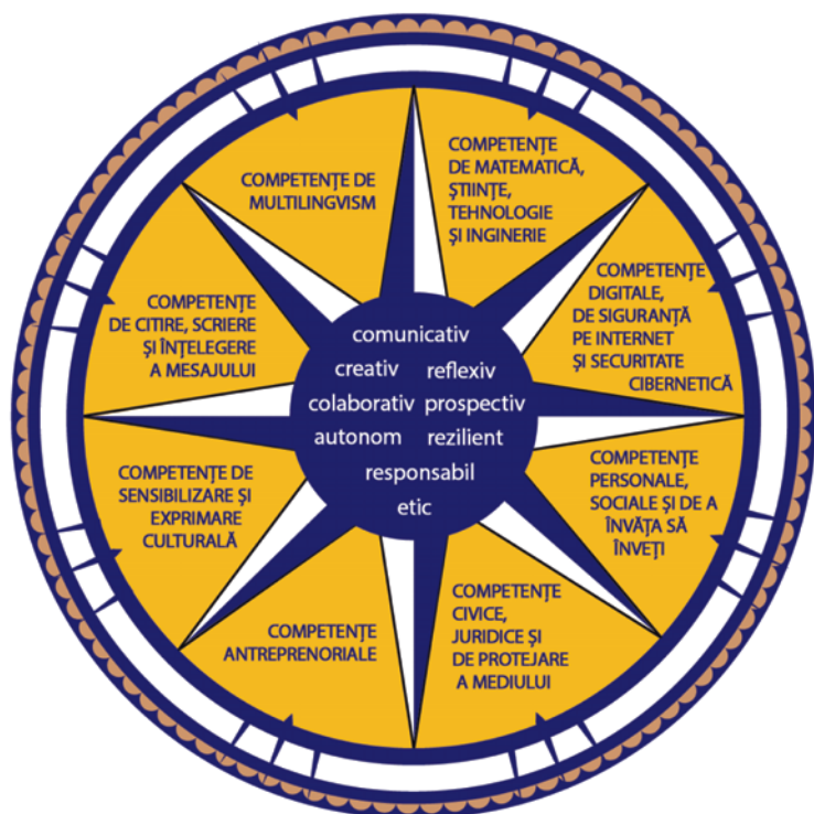
Figura 1*). Dimensiuni principale care contribuie la definirea profilului de formare al absolventului

Profilul de formare al absolventului funcționează ca o busolă pentru întregul sistem educațional, în care elementele continuumului predare-învățare-evaluare conlucrează pentru realizarea idealului educațional definit în lege.