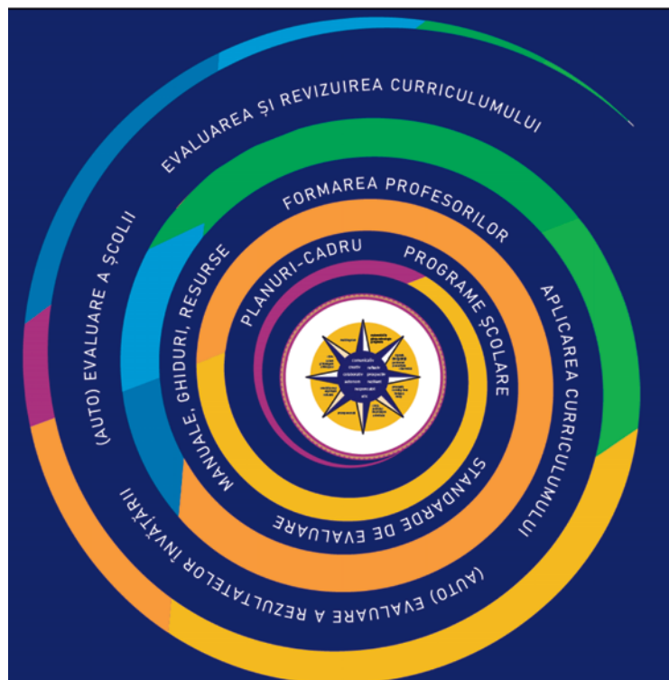
Figura 2**). Continuumul predare-învățare-evaluare

Continuumul predare-învățare-evaluare reunește elementele de construcție curriculară, de suport al curriculumului, de aplicare și evaluare a acestuia: