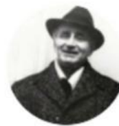
Radu Tudoran Autor